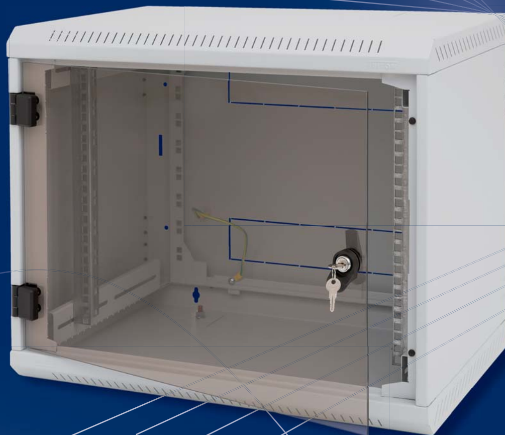
RBA – einteilige Gehäuse